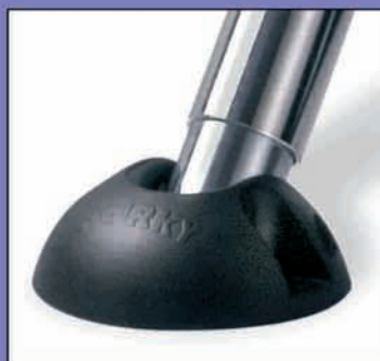
Modello comunitario registrato Nr. 000025721-0003