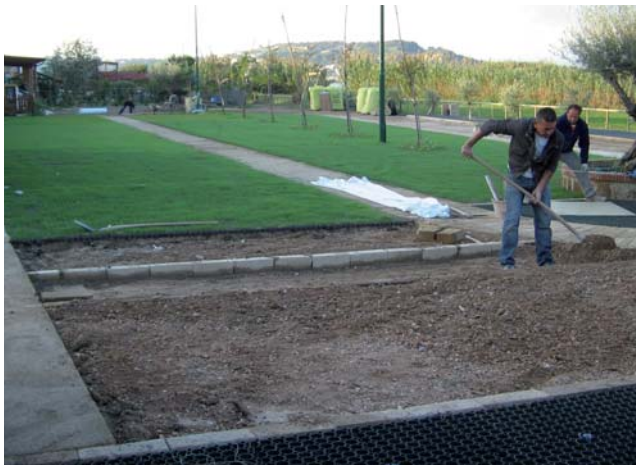
Posa di betagarden® in un parcheggio.