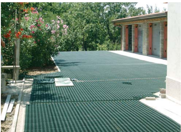
Posa di betagarden® in un parcheggio ad uso privato.