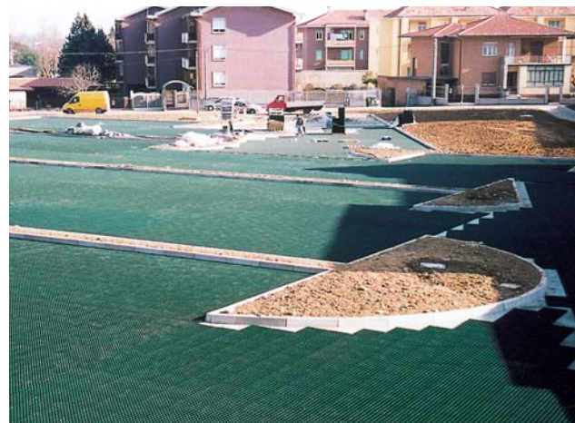
Posa del grigliato in prossimità dei cordoli.