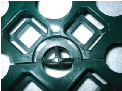
Punto di giunzione e fissaggio tra lastre.