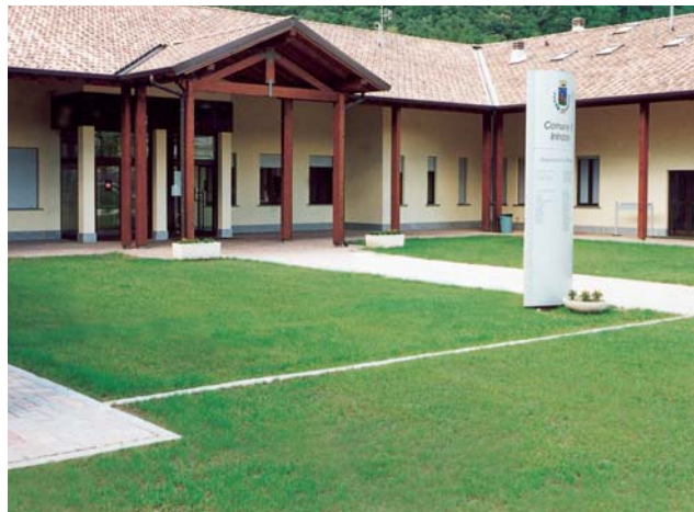
Posa di betagarden® per area pedonale e carrale prima e dopo la crescita dell'erba.