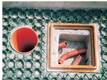
Particolare della posa di tubi e pozzetti.