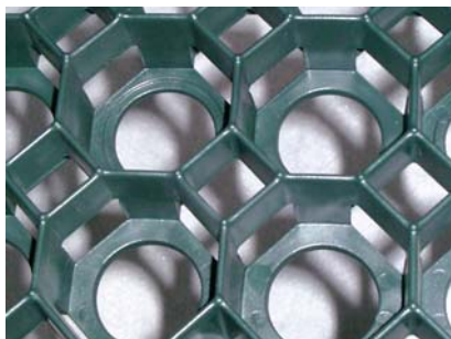
Alveoli aperti su più lati per favorire lo sviluppo e la ramificazione trasversale delle radici, offrendo maggior stabilità al manto erboso.