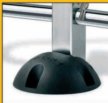
Modello comunitario registrato Nr. 000025721-0004